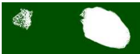
PhotoShop で描画した例。塗りつぶすとペンキをかけたようになってしまう。

PhotoShopなどの市販のグラフィックソフトに比べ、チョークの描画がリアルです。この2つの処理の違いは、一般的な描画がスタンプを用意してそれをずらすような描画法をとっているのに対し、AKI 黒板 Ex は一回の処理ごとに描画を計算している事によります。